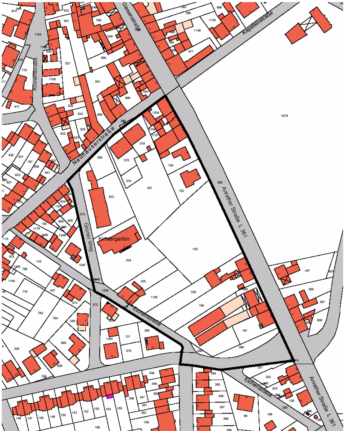
Abgrenzung des Bebauungsplanes Vo-40 "Westlich der Anrather Straße"